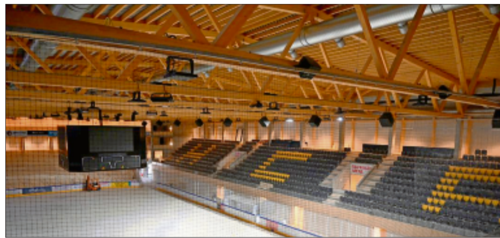
La charpente de la patinoire, que le grand public se languit d'apprécier, est composée d'un mélange d'épicéa et de sapin, ainsi que de frêne. Le bardage extérieur est quant à lui réalisé en sapin.