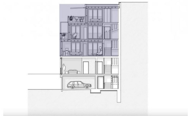
Coupe transversale de la surélévation