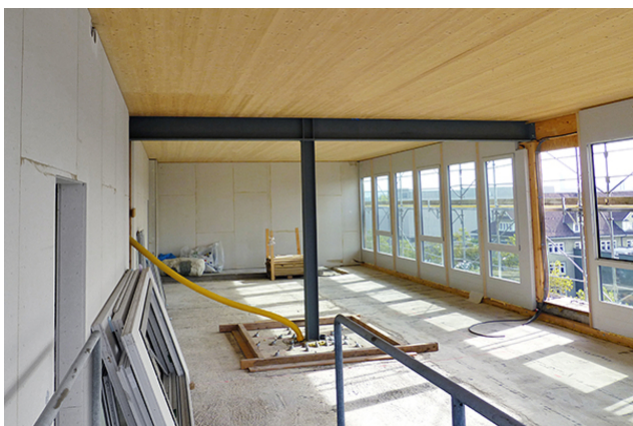
Structure primaire en acier