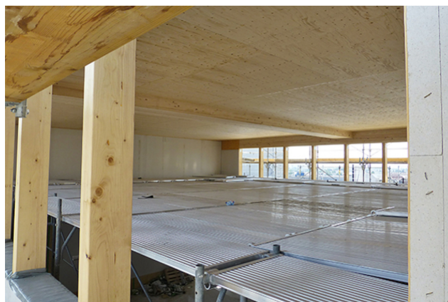
Atrium de plafond de 12 m d'envergure