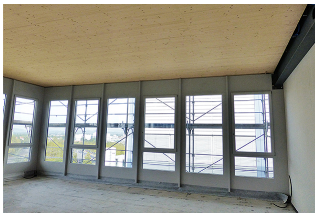
Plafond en bois d'une portée de 9 m