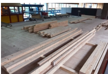
Plate-forme de travail Flück Holzbau AG, Wangen

La Simmental Arena, la nouvelle salle multifonctionnelle de Zweisimmen, est composée en grande partie de bois suisse. De plus, elle n'a pas besoin de piliers à l'intérieur. Le toit est soutenu par dix fermes en arc de 38 mètres de long., Zweisimmen