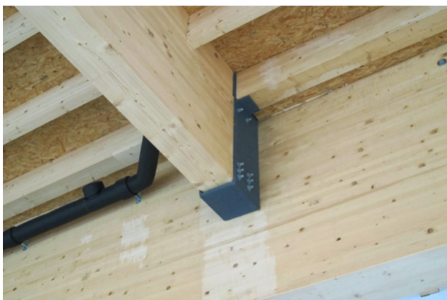
Détail du support de toit