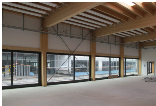
Vue intérieure avec façade en verre