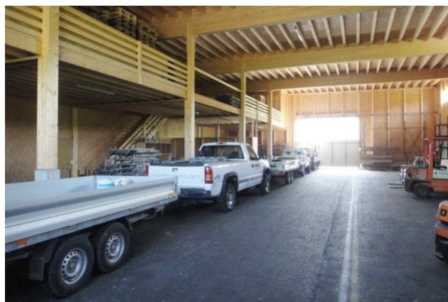
Local de rangement avec galerie