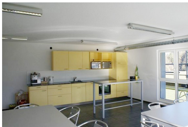
Salle de restauration avec cuisine