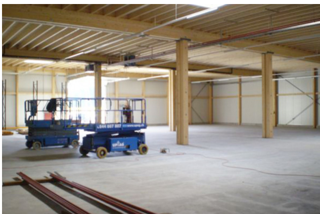
Vue intérieure du gros œuvre