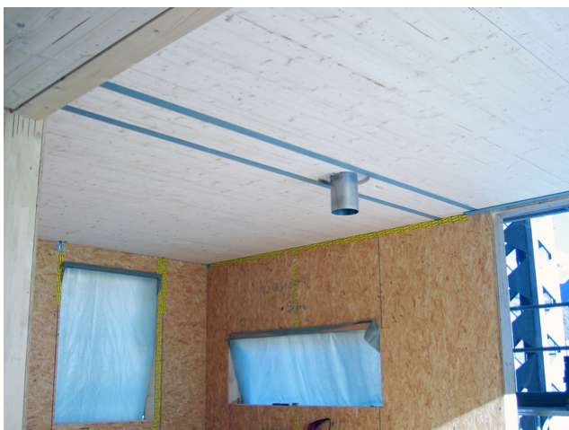
Vue intérieure en direction du bassin de natation

La structure porteuse secondaire est composée d'éléments en caisson creux qui ont été préfabriqués et fixés sur les poutres en lamellé-collé. Le contreventement du bâtiment est assuré d'une part par le mur en béton existant du vestiaire et d'autre part par des parois en bois de contreventement. Afin de supporter les forces importantes, un contrefort est intégré dans l'un des murs. Le toit est renforcé par des panneaux OSB qui stabilisent également la structure porteuse principale. Les murs sont constitués d'une ossature construite par éléments.