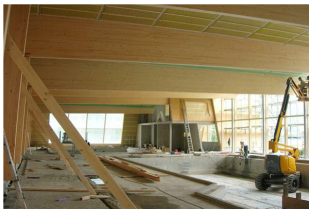
Vue intérieure du gros œuvre