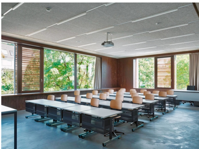
Beaucoup de bois : une atmosphère agréable dans la salle de classe