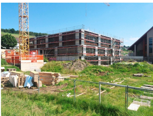
Des délais de construction plus courts grâce au bois