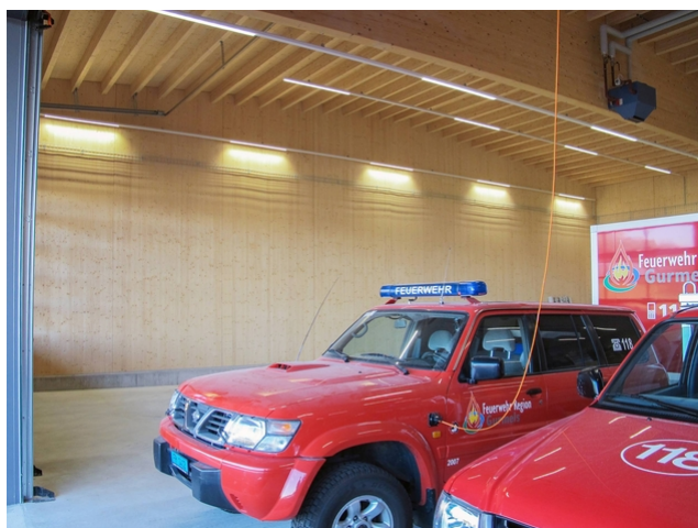
Le nouveau garage offre beaucoup de place pour tous les types de véhicules...

Le contreventement du bâtiment a constitué un défi. Le bâtiment s'ouvre pratiquement entièrement sur l'un de ses grands côtés, ce qui fait qu'il n'y a pas de murs porteurs et de raidissement à cet endroit. De plus, il ne pouvait pas être rattaché au bâtiment existant. Comme le bâtiment n'a pas de murs intérieurs, il n'y avait que peu de murs disponibles pour le contreventement ; en outre, ils ne sont pas disposés de manière très symétrique. De ce fait, le vent et les tremblements de terre peuvent générer des forces importantes dans les murs, qui doivent être transmises aux fondations. Pour assurer le contreventement, des pièces d'acier ont été préalablement insérées dans le béton afin d'y raccorder les murs de contreventement.