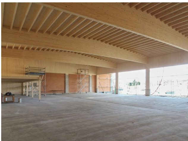
Vue vers l'intérieur : Les traverses de 25 mètres de long supportent le toit du hall