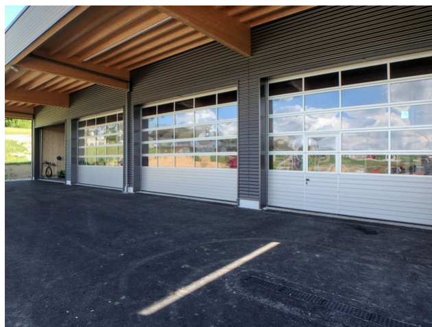
L'avent du nouveau garage a une largeur de 5 mètres.