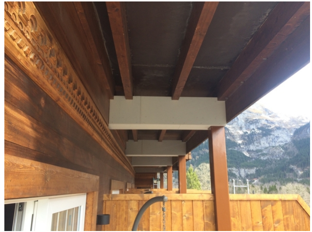
HEB poutre habillée