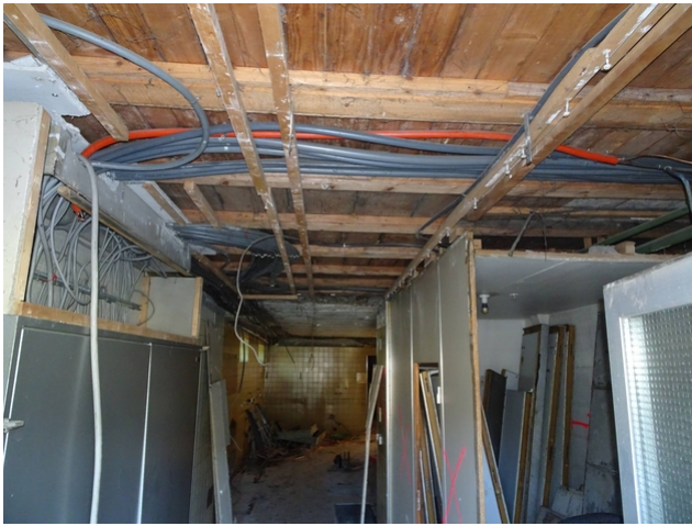
Plafond avant renforcement