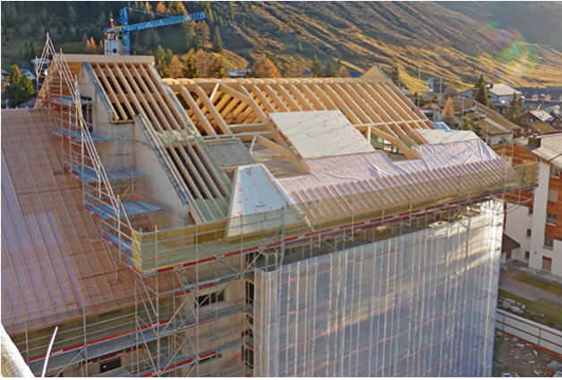
Montage de traverses et d'éléments de toiture Bâtiment H3