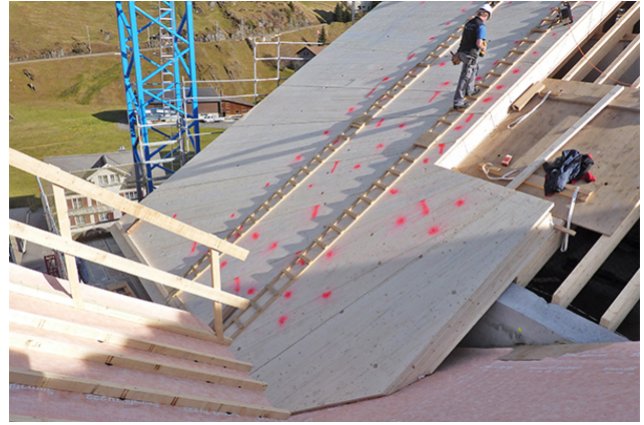
Montage d'éléments de toiture sur la structure primaire