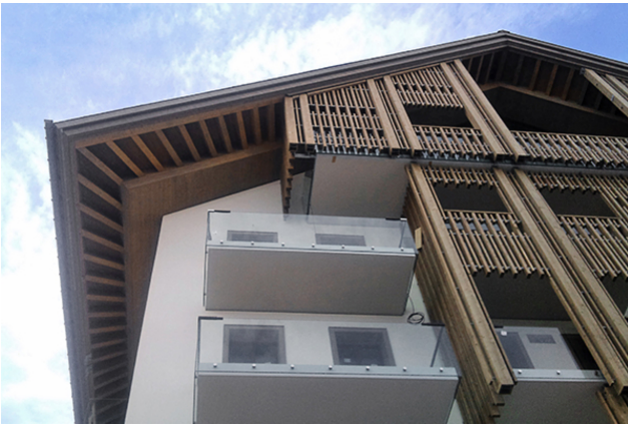
Vue détaillée de la verrière d'angle