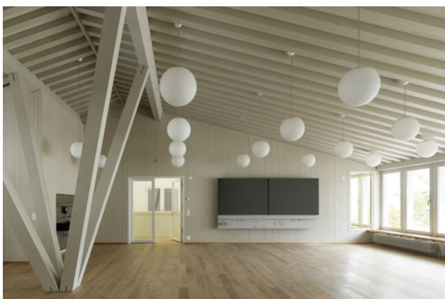
Salle de classe au rez-de-chaussée