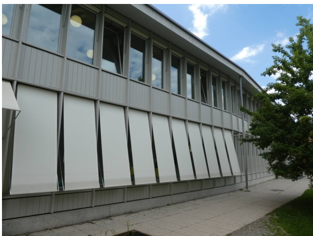
Façade vue Est