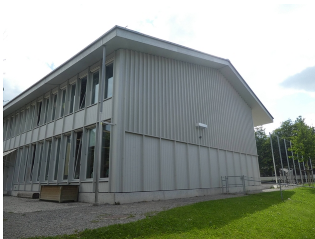
Façade vue nord