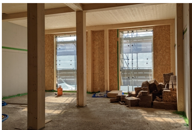
Derrière, le nouveau bâtiment en bois est en cours de construction.