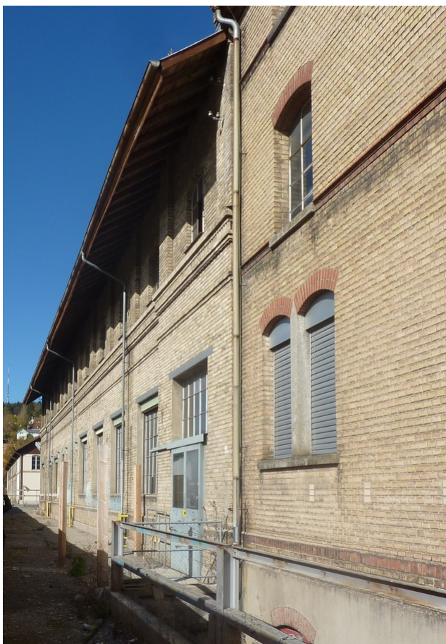
Les façades sont en partie classé monument historique.