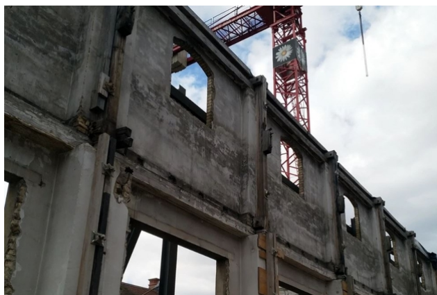
Le bâtiment a été déconstruit, à l'exception de sa façade.