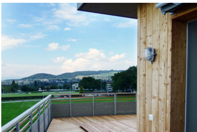
Maison C Terrasse avec vue