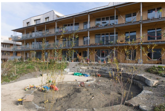
Aire de jeux