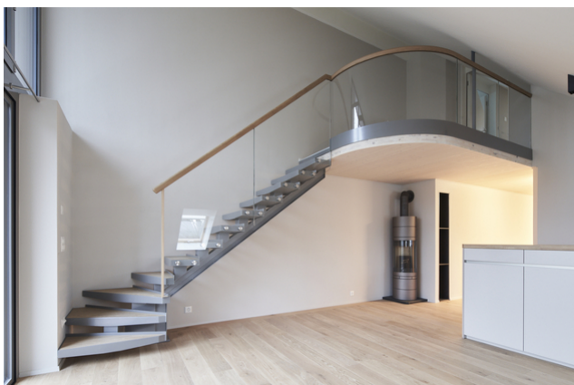
Galerie de l'appartement en duplex