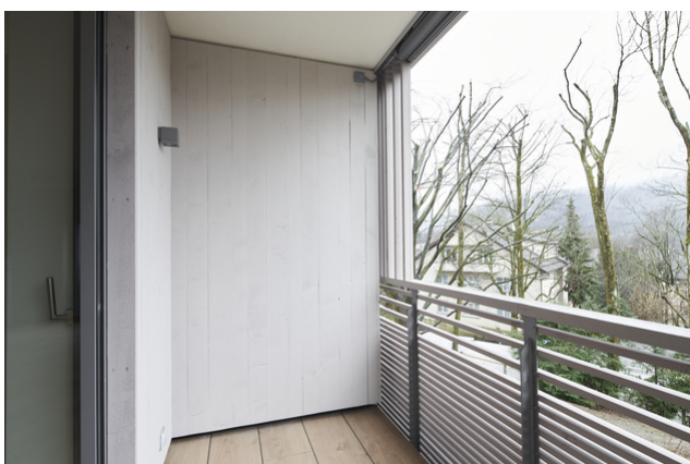
Bois sur la façade et les balcons