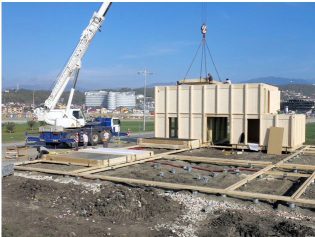
Montage à Sotchi

Les ingénieurs de Timbatec ont dû concevoir un système de construction en bois robuste, démontable et économique, qui soit stable, sûr et étanche à la pluie dans toutes les situations. La solution a été trouvée grâce à une construction à nervures, qui se répète aussi bien dans les murs que dans les planchers et le toit.