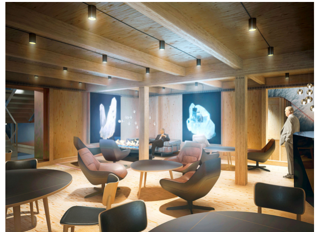
Visualisation de l'intérieur du salon