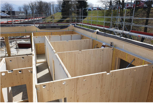
Murs intérieurs en bois lamellé-croisé