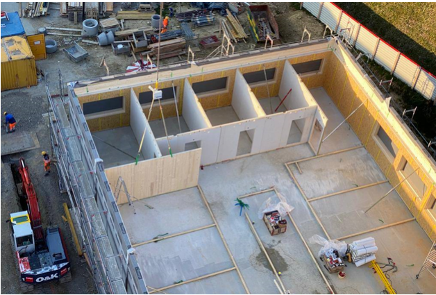
Montage des parois intérieures