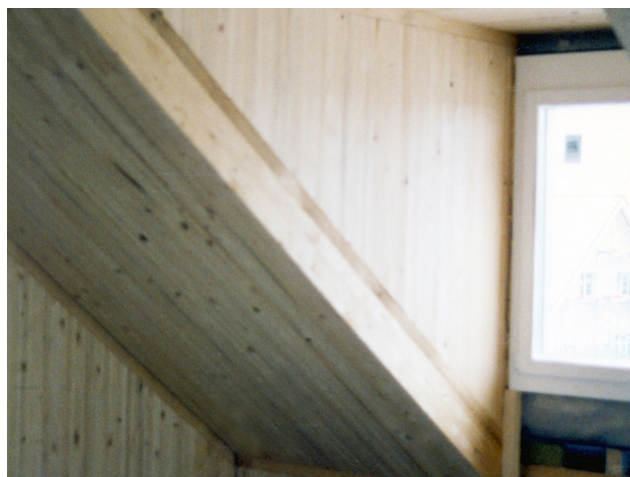
Lucarne de l'intérieur