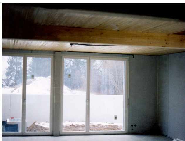
Un coup d'œil dans le salon en cours de construction