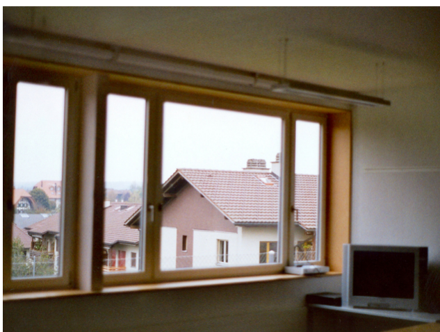
L'intérieur d'une salle de classe