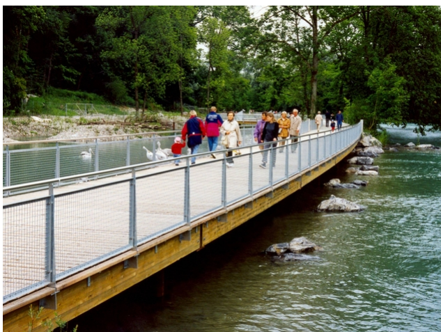
Chemin piétonnier en service