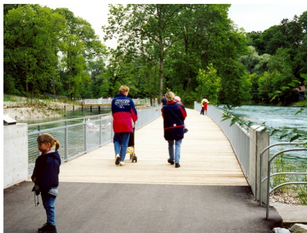
Le début du pont