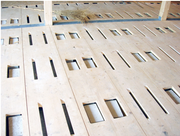
Remplir la signature d'ouverture Silence