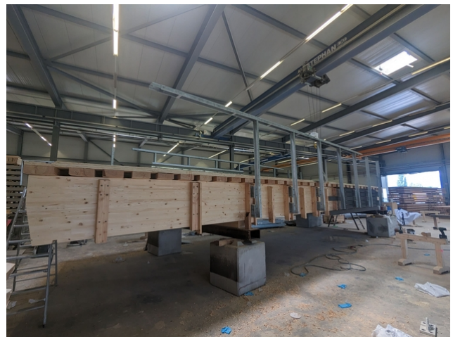
Préfabrication du pont dans les Ateliers de JPF-Ducret.