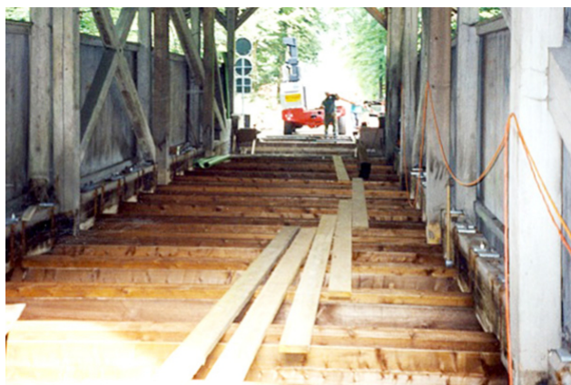
Montage de la traverse