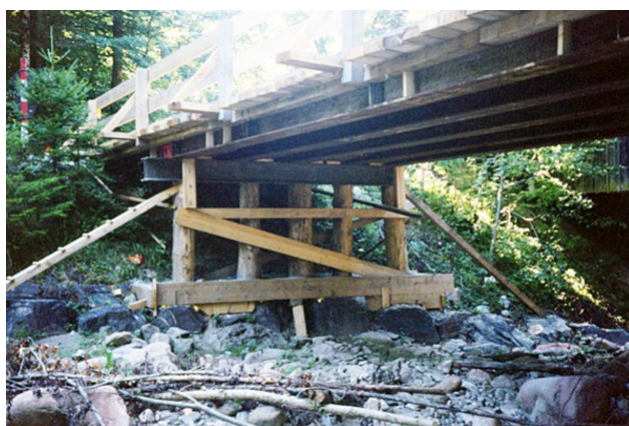
Pont de secours avec poutres en acier