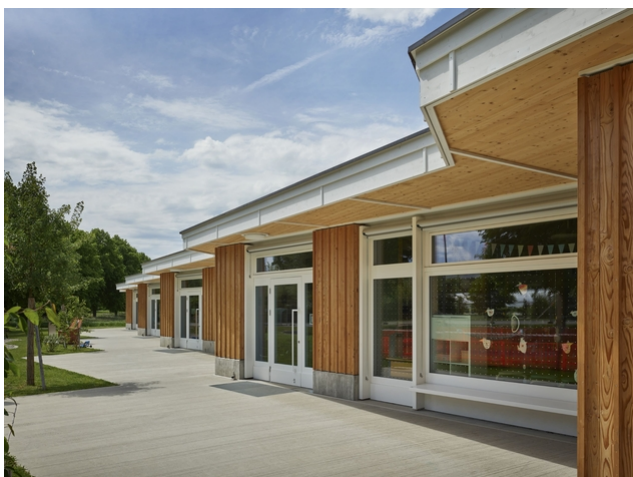
Vue extérieure après l'achèvement