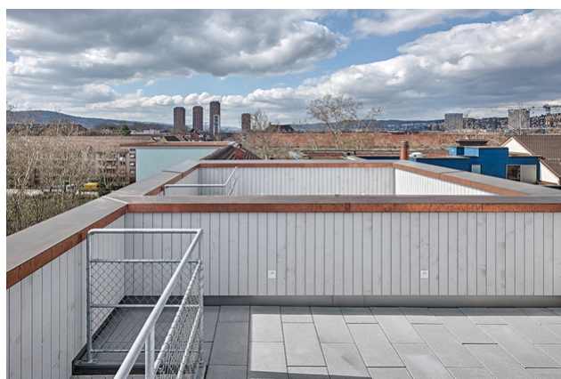
Terrasse sur le toit