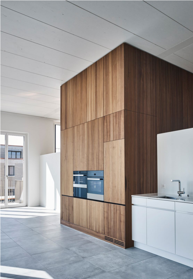
Vue de la cuisine