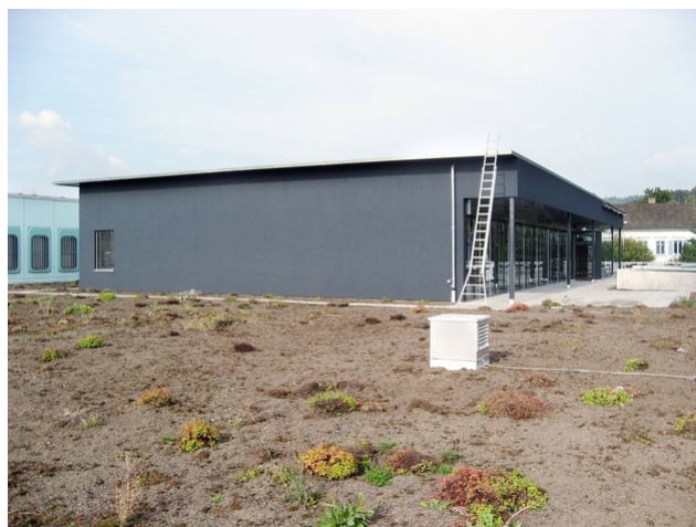
Vue de la surélévation