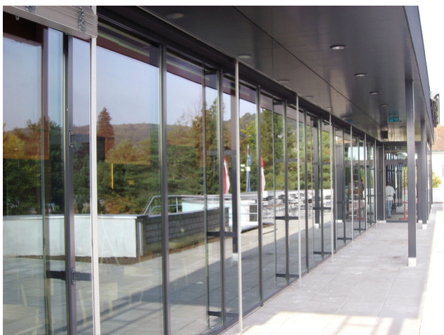
Entrée du restaurant