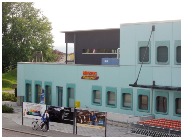
Vue du côté nord avec bandeau lumineux