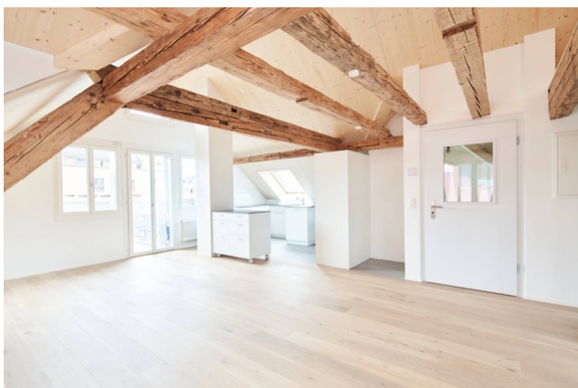
Chambre avec cuisine