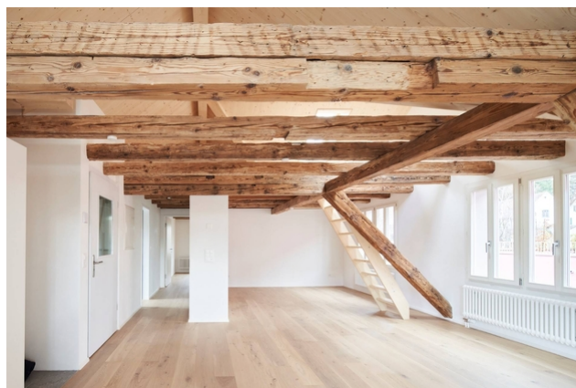
Chambre (avec montée)