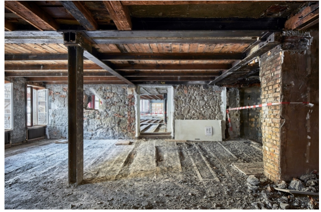
Travaux de construction