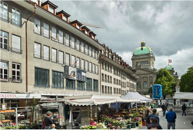
La façade avec vue sur le Palais fédéral