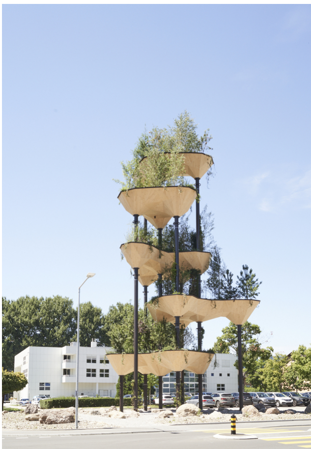
Semiramis au cœur du Tech Cluster