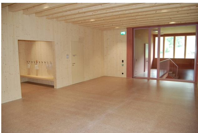
Cage d'escalier avec vestiaire