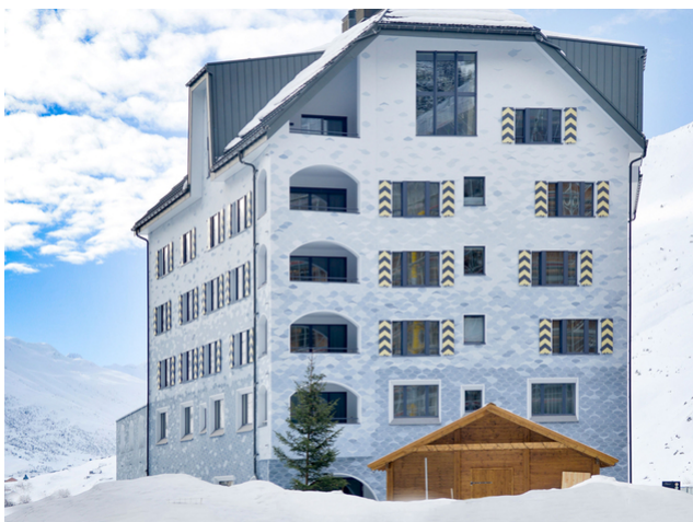
Schwerlast-Dächer: Timbatec plante die Dachkonstruktionen