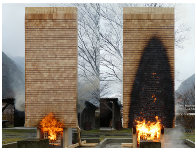
Ein Brandversuch der Schindelfassade