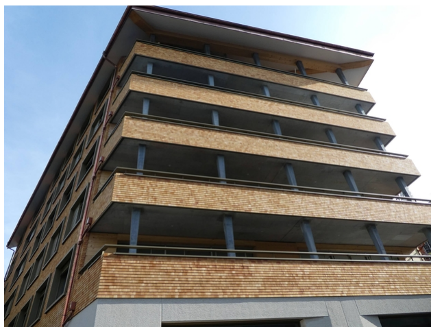
Appartementhaus Wolf: Bedeckt mit Holzschindeln von oben nach unten