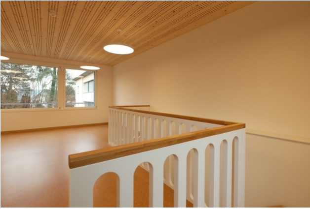
Neben Haupträumen wurden auch separate Gruppen- und Therapieräumlichkeiten geschaffen.