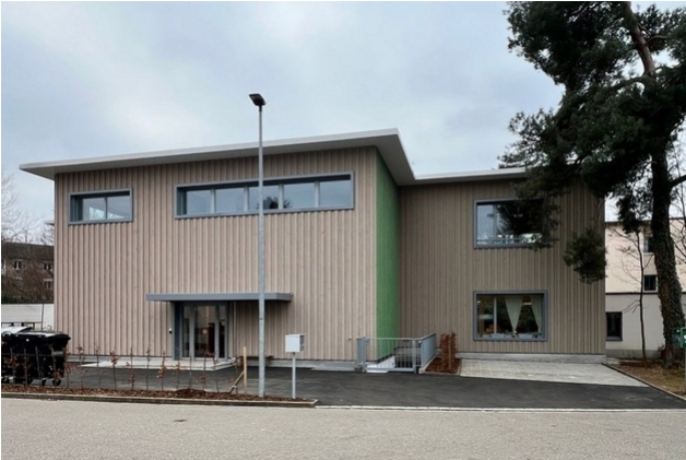
Die vertikale Fassadenverkleidung in Holz verläuft über beide Geschosse.