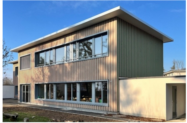
Im Zuge der Aufstockung erhielt der Kindergarten ein neues Holzkleid.