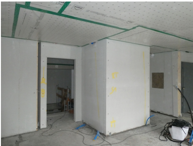
Gekapseltes Treppenhaus in der Bauphase