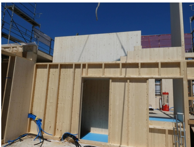
Montage der Holzbauerelemente