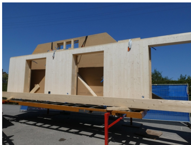
Anlieferung der Holzbauerelemente