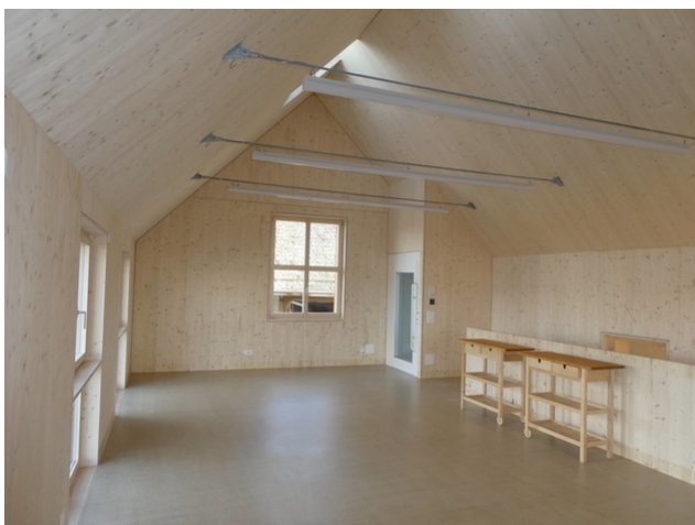
Zugstange zur Aufnahme der statischen Kräfte