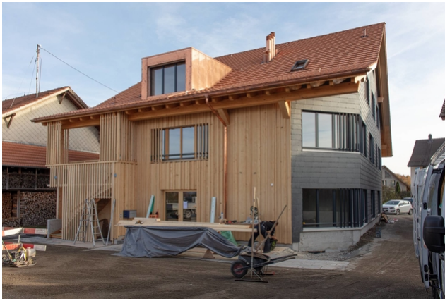
Brandschutzfassade zum Nachbarhaus