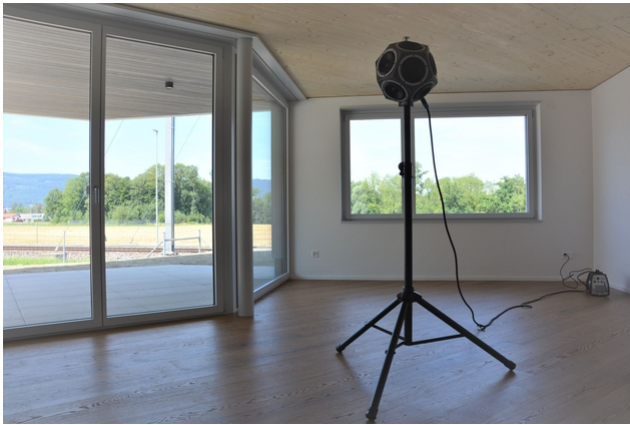
Ansicht Stützen-Plattenverbindung und Akustikmessungen