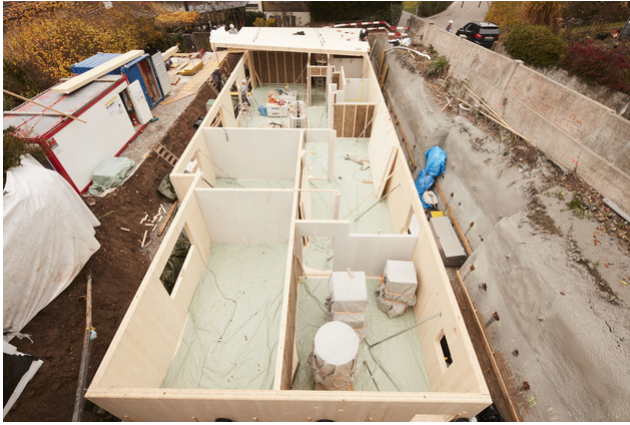
Untergeschoss aus Holz