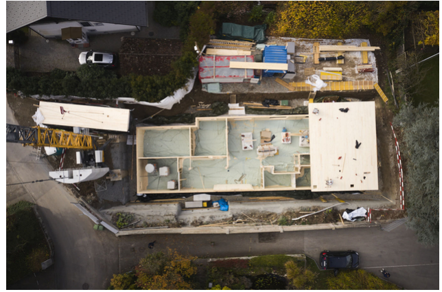
Flugaufnahme Untergeschoss aus Holz