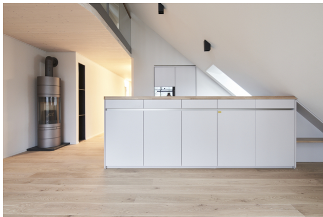
Küchenbereich mit Schwedenofen