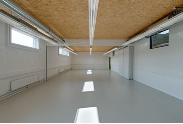
Innenansicht der Halle