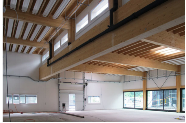
Die Hülle der Halle