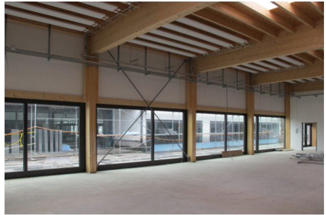
Innenansicht mit Glasfront