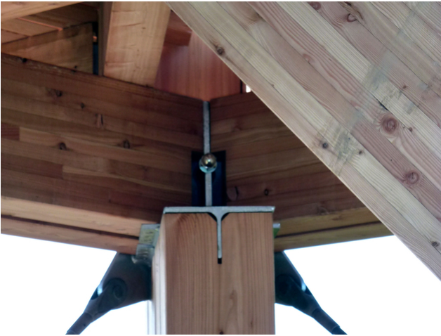
Auflager Plattform 2