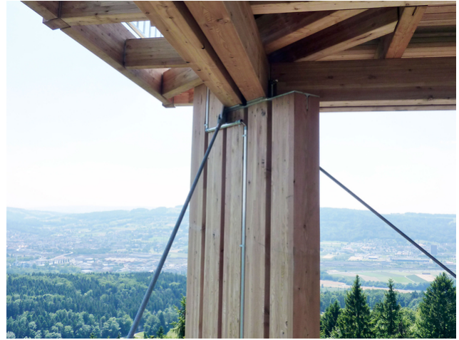
Auflager Plattform 1