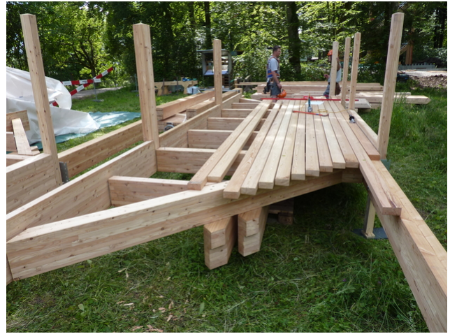
Zusammenbau des Turms