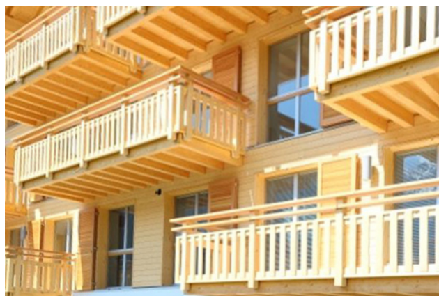
Fassade mit Balkonen