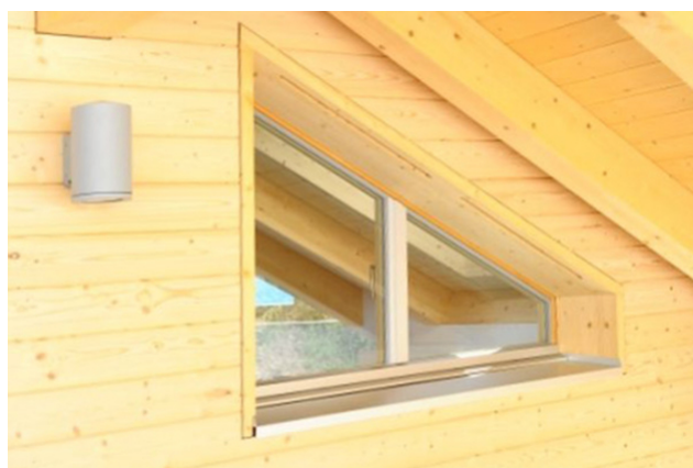
Fenster Detail, Foto Wenger Fenster Wimmis