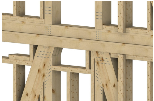
Werkplanung mit Detailausbildung im 2d und 3d