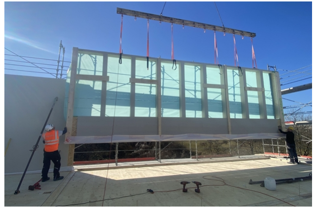
Aufrichtung von vorgefertigten Wandelementen

- SIA Phase 51 Ausführungsprojekt - Werkplanung 3D und 2D