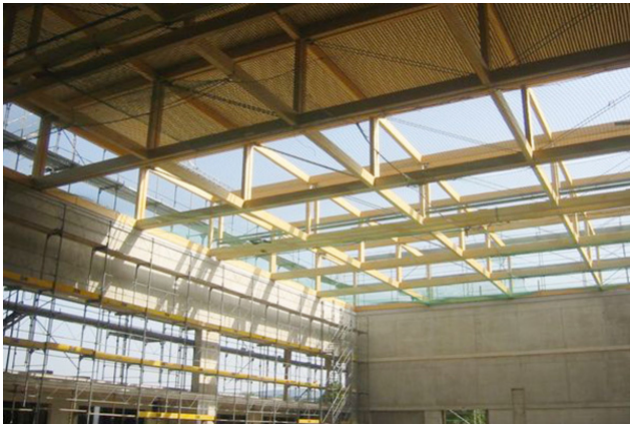
Montage von Dachelementen