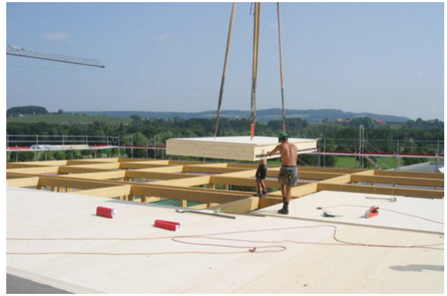
Montage von Dachelementen