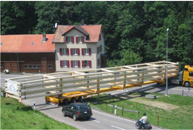
Transport Binder: Eng ist's im Appenzellerland