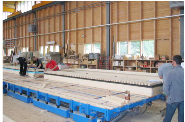
Herstellung von Dachelementen