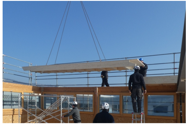
Anbringen eines Dachelements