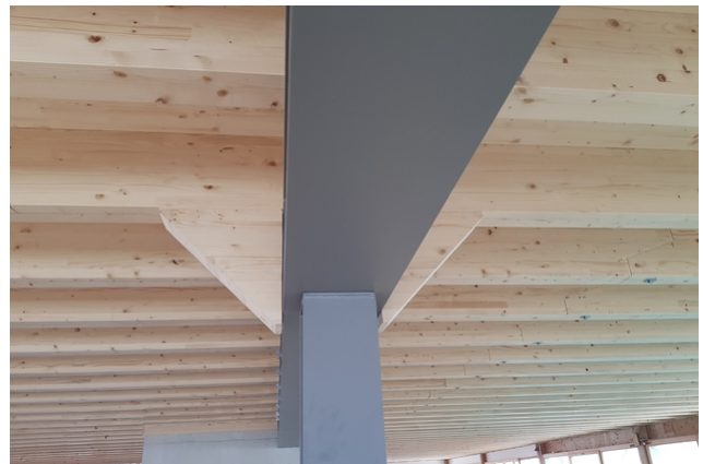
Kombination von Stahltragwerk und Holzbau