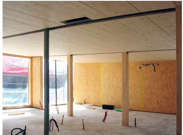
Stützen in Holz