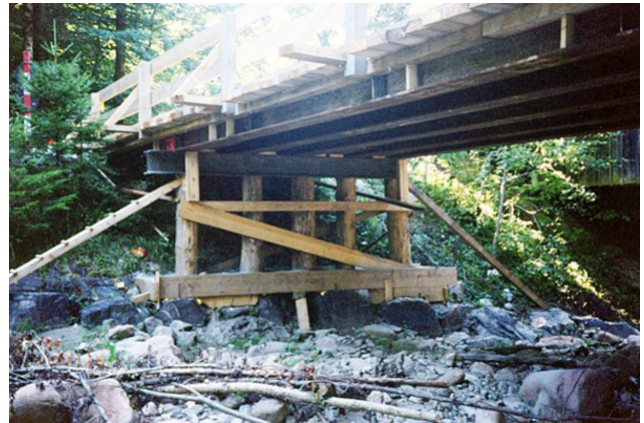
Notbrücke mit Stahlträgern