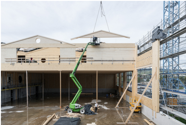
Holzbau-Aufrichtarbeiten: Über der Turnhalle wird das Raumprogramm aufgerichtet