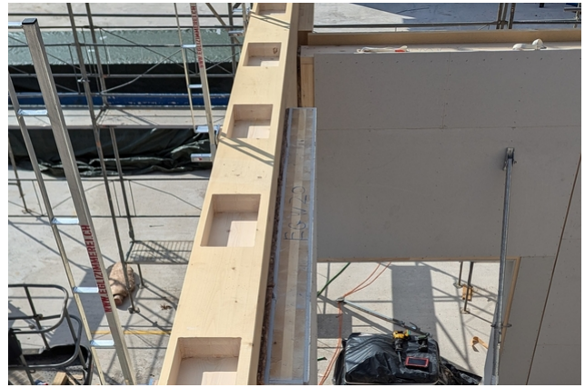
ausgefäste Taschen zur Aufnahme der Schubnocken des Vierendeelträgers