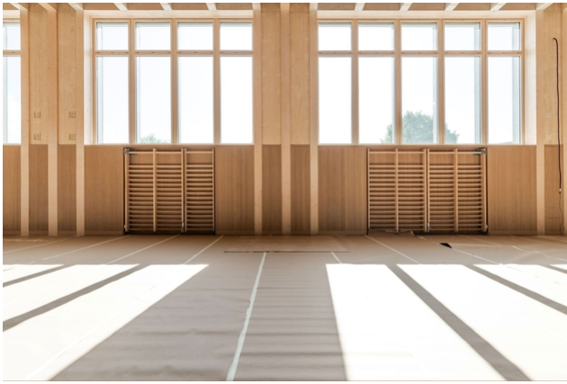
Innenansicht Turnhalle in der Rohbauphase